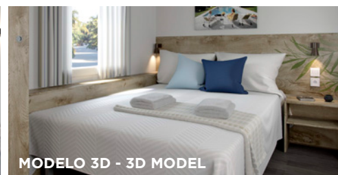
MODELO 3D - 3D MODEL