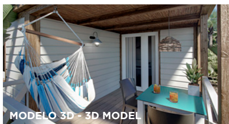
MODELO 3D - 3D MODEL