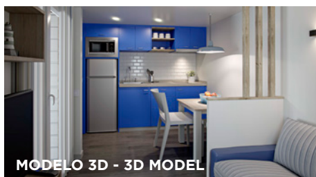
MODELO 3D - 3D MODEL